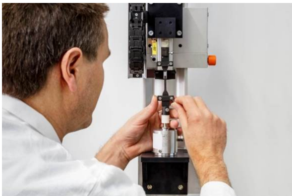
Genauere Messeinrichtung für eine qualitativ hochwertige Messung beim Treppenstufenversuch.