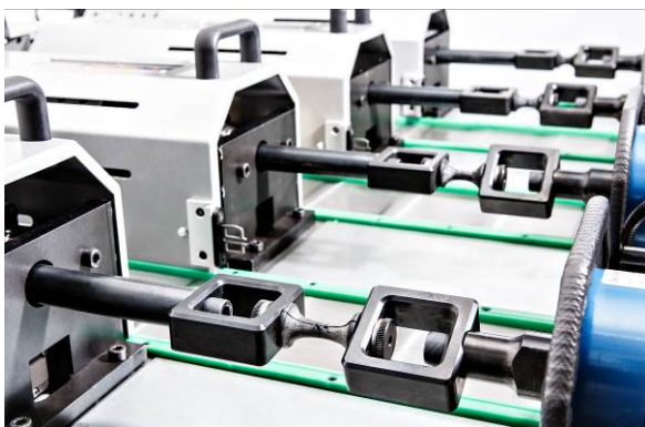
Prüfung von Materialproben auf unabhängigen Prüfaxen, angetrieben von elektro-mechanischen Aktuatoren.